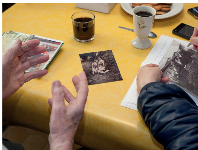
© Maxime Couturier pour le projet Nous vieillirons ensemble, porté par le Pôle Culture et Santé en Nouvelle-Aquitaine

La silver économie n'est pas une filière mais un marché en émergence. Afin de contribuer à le faire naître, la Région s'est engagée depuis plusieurs années en faveur de l'accompagnement des entreprises proposant des produits et des services entrant dans le champ de la Silver économie. Ces entreprises sont hétérogènes, tant par leur taille (de la start-up au grand groupe) que par les secteurs dont elles relèvent (habitat, dispositif médical, numérique, maintien à domicile...). La silver économie est l'une des 12 filières et marchés stratégiques de la Nouvelle-Aquitaine.