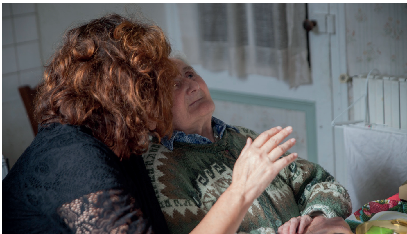
© Maxime Couturier pour le projet Nous vieillirons ensemble, porté par le Pôle Culture et Santé en Nouvelle-Aquitaine